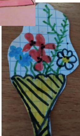
Рис. Насти Чикиш, 6д