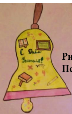
Рис. Дарьи Петрусевой, 5г