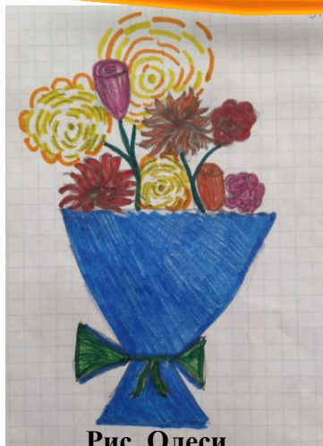
Рис. Олеси Тишуренковой, 4а