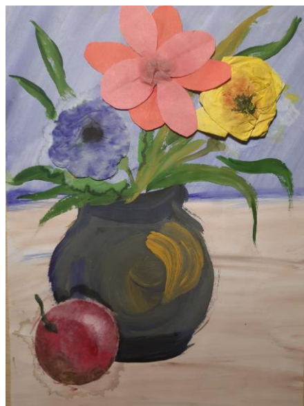
Рис. Полины Сокольниковой, 5д