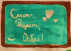
Рис. Таисии Шангареевой, 4а