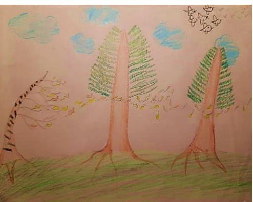
Рис. Полины Сокольниковой, 5д