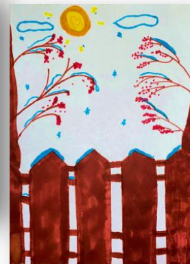
Рис. Софии Попович, 5В

Холодный воздух морозит лица вышедших на улицу людей. По мне, это лучше, чем жаркая температура лета. Дети, одетые как капуста, катаются со снежных горок. Горки бывают с кочками, прямые, волнистые, очень-очень длинные и короткие. Я это помню еще со времён, когда тоже каталась с них.