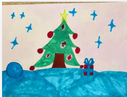
Рис. Кристины Товарищевой, 5В