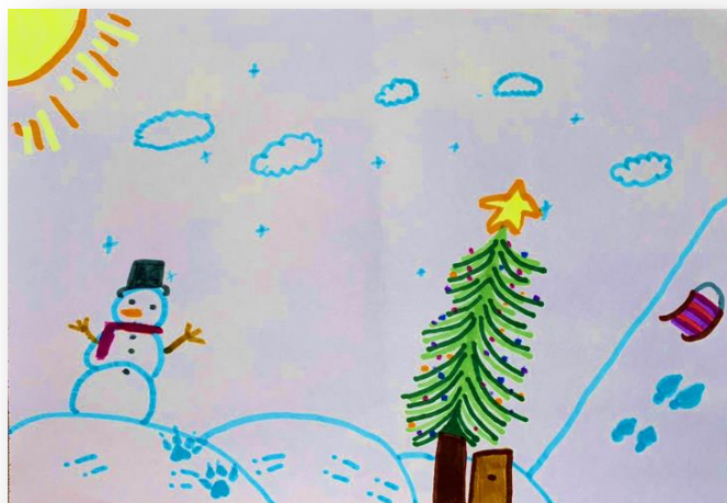
Рис. Алисы Гижа, 5В