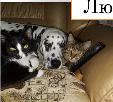
кот Лёня (справа), кот Макс и собака Цезарь

Я люблю своего кота Макса. Он почти полностью чёрный, лишь лапки наполовину белые. Он живёт в городе Тайшете в доме моего папы.