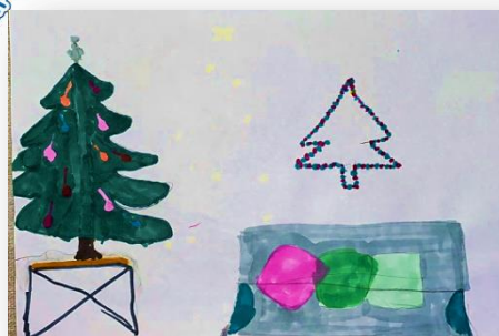
Рис. Марии Поповой, 5Г