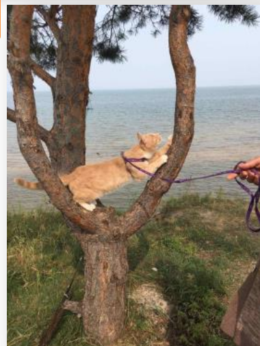
Любимец семьи Ахметовых: кот Кеша.

У меня есть собака и кот. Собаку зовут Лили, можно называть её Ликой. Кота зовут Снежный Барс, можно просто Барс.