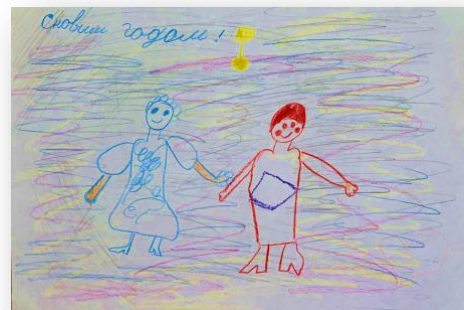
Рис. Александры Башеевой, 1Д