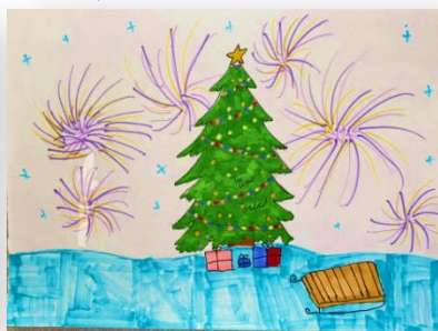
Рис. Саяны Астунаевой, 5Г

На зимних каникулах всегда очень весело. С подругами мы очень много гуляем, играем в снежки и просто лежим в снегу. С родителями мы часто ездим на различные горки и праздники. В Новый год я помогаю маме готовить. Ем мандарины, слушаю новогоднюю музыку и играю в разные игры. Встречаем Новый год мы обычно втроем: мама, папа и я. После того, как мы встретили Новый год, идём запускать фейерверки, а после этого гуляем всю ночь.