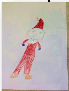
Рис. Дианы Даниловой, 2Б