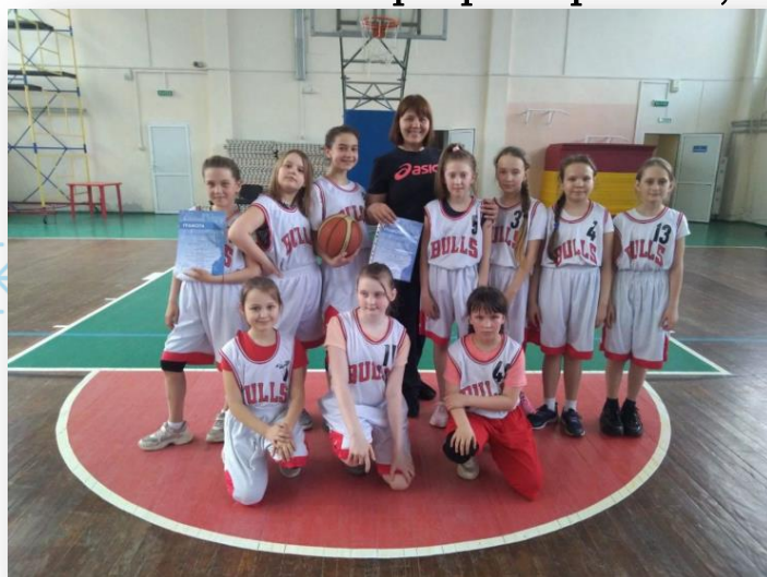
Баскетбольная команда.